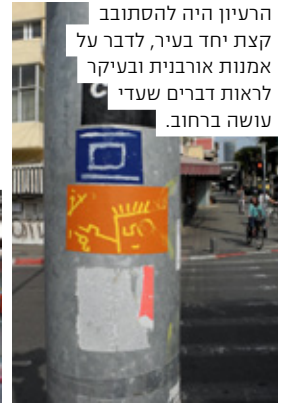
הרעיון היה להסתובב קצת יחד בעיר, לדבר על אמנות אורבנית ובעיקר לראות דברים שעדי עושה ברחוב.