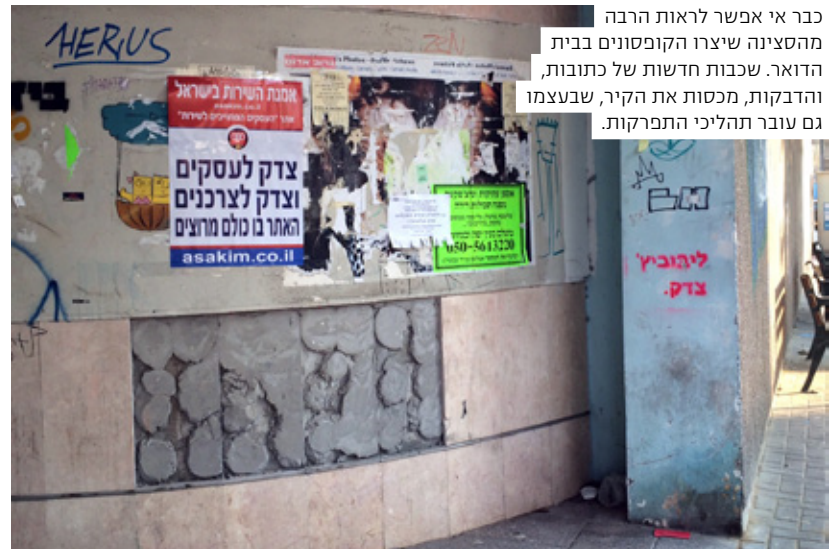
כבר אי אפשר לראות הרבה מהסצנה שיצרו הקופסונים בבית הדואר. שכבות חדשות של כתובות, והדבקות, מכסות את הקיר, שבעצמו גם עובר תהליכי התפרקות.