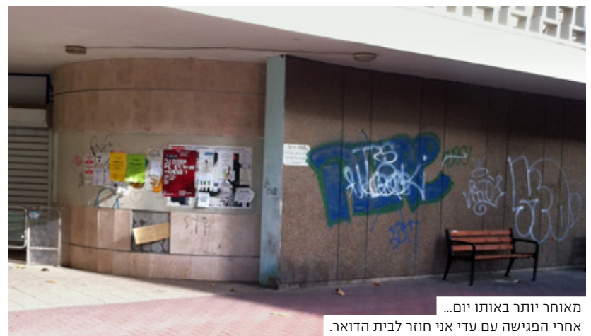
מאוחר יותר באותו יום... אחרי הפגישה עם עדי אני חוזר לבית הדואר.