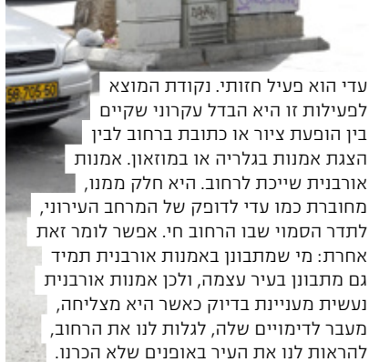
עדי הוא פעיל חזותי. נקודת המוצא לפעילות זו היא הבדל עקרוני שקיים בין הופעת ציור או כתובת ברחוב לבין הצגת אמנות בגלריה או במוזאון. אמנות אורבנית שייכת לרחוב. היא חלק ממנו, מחוברת כמו עדי לדופק של המרחב העירוני, לתדר הסמוי שבו הרחוב חי. אפשר לומר זאת אחרת: מי שמתבונן באמנות אורבנית תמיד גם מתבונן בעיר עצמה, ולכן אמנות אורבנית נעשית מעניינת בדיוק כאשר היא מצליחה, מעבר לדימויים שלה, לגלות לנו את הרחוב, להראות לנו את העיר באופנים שלא הכרנו.