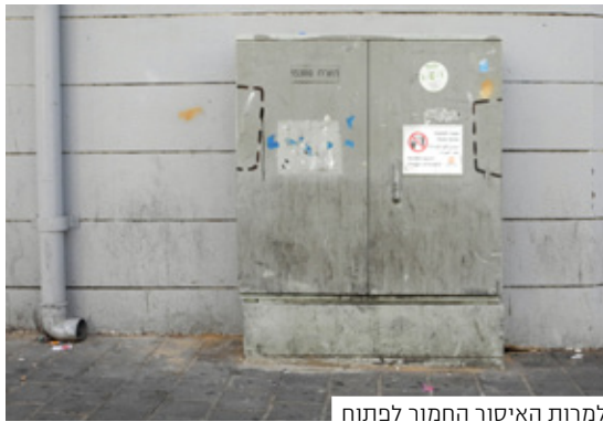
למרות האיסור החמור לפתוח