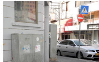
עדי לא מגיע ואני מסתכל בעוד קופסה, הפעם קופסה שעומדת לבדה. על הקופסה יש אזהרה: "אסור לפתוח! סכנת מוות!" חתיכת איסור. מסתבר שהמוות נמצא קרוב, ממש מתחת לאף.