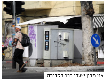
אני מבין שעדי כבר בסביבה.