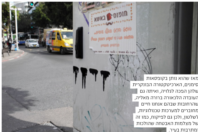
מאז שהוא נותן בקופסאות סימנים, הארכיטקטורה הבונקרית שלהן הפכה לגלויה, ואיתה גם העובדה הלכאורה ברורה מאליה, שהרחובות שבהם אנחנו חיים מחוברים למערכות טכנולוגיות, לשלטון, ולכן גם לפיקוח, כמו זה של מצלמות האבטחה שהולכות ומתרבות בעיר.