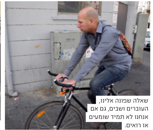
שאלה שפונה אלינו, העוברים ושבים, גם אם אנחנו לא תמיד שומעים או רואים.