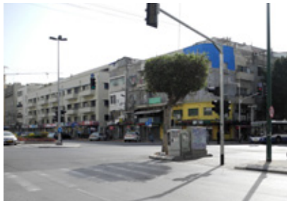
אני רוצה לדבר עם עדי על השכבות של הדימויים בעיר, על הקשרים בין הדימויים שלו לדימויים אחרים שנמצאים תמיד בסביבה ועל מה שעושה ההתערבות החזותית שלו לעיר.