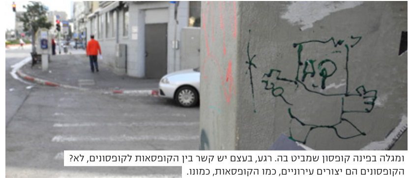
ומגלה בפניה קופסון שמביט בה. רגע, בעצם יש קשר בין הקופסאות לקופסונים, לא? הקופסונים הם יצורים עירוניים, כמו הקופסאות, כמון.