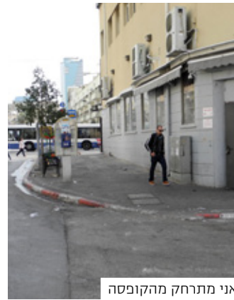
אני מתרחק מהקופסה