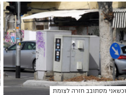
וכשאני מסתובב חזרה לצומת