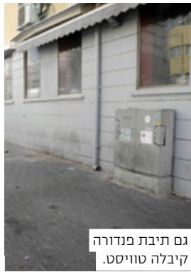
גם תיבת פנדורה קיבלה טוויסט.