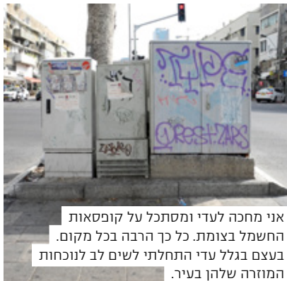
אני מחכה לעדי ומסתכל על קופסאות החשמל בצומת. כל כך הרבה בכל מקום. בעצם בגלל עדי התחלתי לשים לב לנוכחות המזרה שלהן בעיר.