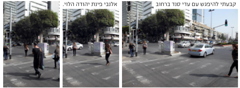
אלנבי פינת יהודה הלוי