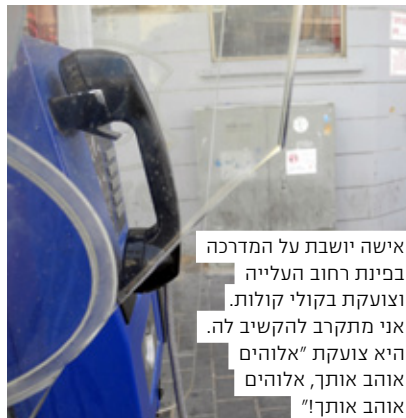
אישה יושבת על המדרכה בפינת רחוב העלייה וצועקת בקולי קולות. אני מתקרב להקשיב לה. היא צועקת "אלוהים אוהב אותך, אלוהים אוהב אותך!"