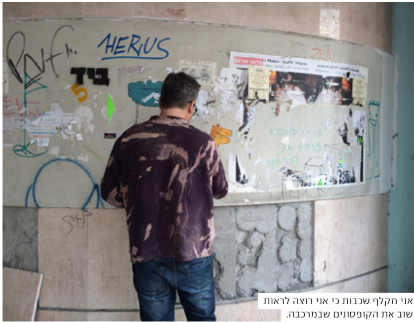
אני מקלף שכבות כי אני רוצה לראות שוב את הקופסונים שבמרכבה.