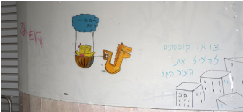
אבל לפני שנתיים או שלוש הקופסונים במרכבה דאו לבדם במרחב הבלתי מוגבל, ויום אחד גם זכו לקבלת פנים רשמית: מישהו הוסיף בתים בכמה קווים וכתובת שקראה אליהם: בואו קופסונים להציל את העיר הזו!