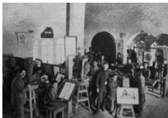
תמונה 3: המחלקה לציור, תורה ומלאכה, ירושלים, 1905 בקירוב, מקור: Ost und West , Vol. 7, July 1908, pp. 765-784