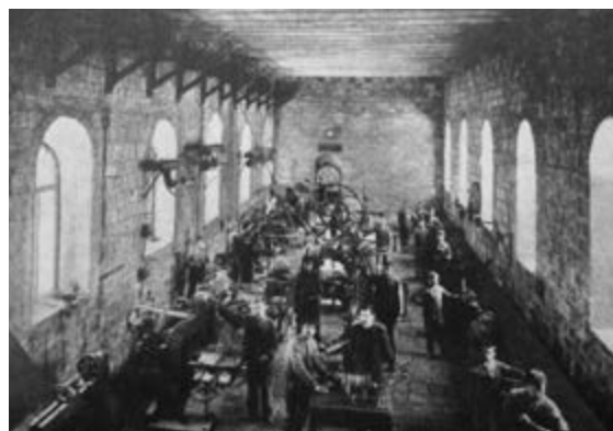
תמונה 2: המחלקה למכניקה, תורה ומלאכה, ירושלים, 1905 בקירוב