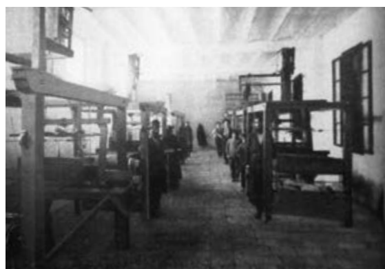
תמונה 4: המחלקה לטווייה, תורה ומלאכה, ירושלים, 1905 בקירוב, מקור: Ost und West , Vol. 7, July 1908, pp. 765-784

שהביא לבית־ספרו ציירים יהודים דגולים (כגון שמואל הירשנברג, לזר קרסטין, אָפֶל פֶּן ואחרים).