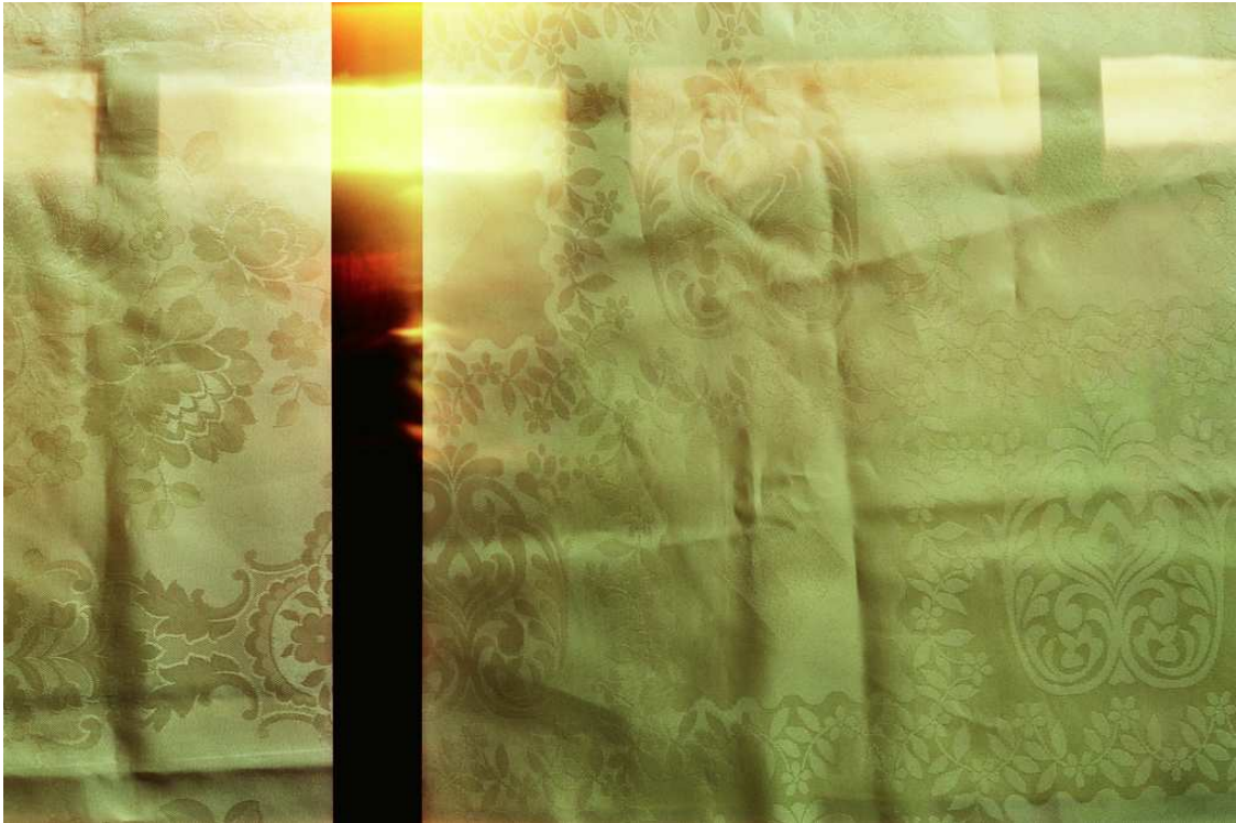
צילום מס' 2 : Photography_on_Film