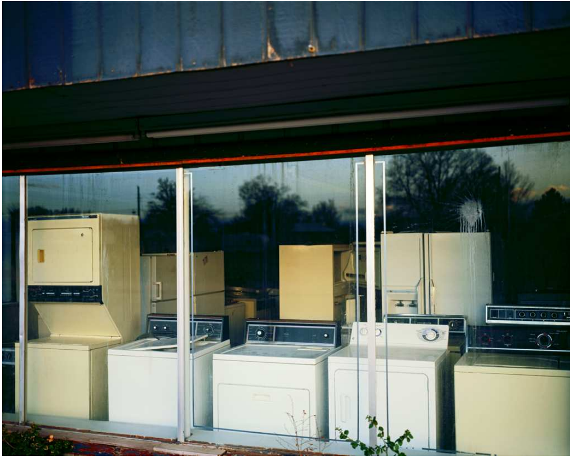
צילום מס' 1: Modern_Background