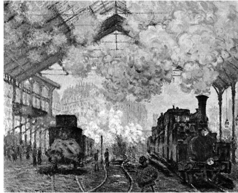
2. קלוד מונה, תחנת טן־זאר, 1877, שמן על בד

מבטי ממשיך לשוטט. הסוסים מושכים קרונית לאורך מסילה המתפתלת בעיקול רחוב, בזווית המסתירה את המתרחש מאחוריה. סוסים נוספים מופיעים מימין. האם לפנינו תחנה למנוחה ותחזוקה? הסצנה מלאה אדים: הבל פיהם וחום גופם של הסוסים הפוגשים באוויר הקר. אני ממש שומע את צלילי פרסות סוסים המבוססות בשלג ואת חריקות גלגלי הקרונית על הפסים הקפואים וחש בקור העז, רוצה לחפון את ידי בכיסים. האדים בתמונה מזכירים לי אחד מאותם הימים של שוטטות ברחובות ניו יורק הקרה בעודי משתדל להפשיר בחום האש של מוכר הערמונים; ניו יורק, שאוויר חם נפלט בה מפתחי הרכבת התחתית הקבועים בכביש או בשולי המדרכות. מבטי נתפס בסוס הקדמי, שכן האיש שבחזית נסתר ממני, מפנה אליי את גבו. אמנם מתארו הניגודי מציג את נוכחותו, אך הוא מוסתר לחלוטין מאחורי המעיל הארוך והכובע הבלוי. סביר להניח שהוא העגלון: האם הוא קורא לסוסים לעצור? אולי לצאת לדרך? אולי להיזהר בסיבוב החלקלק? המבט נע שמאלה לעומק מישור התמונה, אל האיש הלבוש מעיל, חובש מגבעת ובידו מטרייה, הממהר לצאת מן הפריים, בין הקרונית לבין כרכרה פרטית קטנה שמאחוריו. משהו מציק לי: יחסי הגודל בין ה"עגלון" לבין האיש אינם הגיוניים; כיצד הוא נראה רחוק כל כך כאשר המרחק ביניהם קצר יחסית? מה קורה לפרספקטיבה שלי, לאוריינטציה שלי? אני מבחין שהצלם תפס את הקרונית והסוסים בדיוק בעיקול המסילה, וכך נוצרה פרספקטיבה מיוחדת בין הסוסים שפונים ימינה לבין קרונית המתכת שעדיין מתקדמת שמאלה. אני חש שתפיסתי את האירוע המצולם מקיפה לפחות שתי פרספקטיבות: האחת מכוונת בידי הצלם, מימין לשמאל – והאחרת משמאל לימין, בעיקר בשל ההטיה של הקרון ונטיית הבניין שברקע; שכן לא זווית הראייה היא שמבנה את תחושת המשוקעות שלנו בעולם, אלא הגוף המכיל