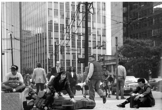
8. ג'ף וול, הבלוק המכשיל, שקף סיבאכרום בקופסת אור, 290x370 ס"מ