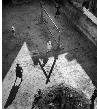
5. אימרה קינסקי, ללא כותרת, 1931, תצלום שחור-לבן בהדפסת כסף ג'לטינית, 17.8x17 ס"מ

מטילה את צל הגשר והמעקה לימין התצלום ( \searrow ), והאחרת מטילה את צל האנשים המצולמים (והעוזרים המכניים שלהם) לשמאלו ( \swarrow ). העיסוק בהיטלי הצל השונים מביא אותי לחשוב על מקור האור בתצלום – השמש, שמחוץ לפריים – ואגב זאת על מעשה הצילום עצמו. ככל שמבטי ממשך לשוטט בתצלום, אני משתקע בשאלה מדוע אינני יכול להסיר את מבטי מן הצל ובפרט מצורת המעוין שהצללים משרטטים, מעוין שחציו שחור וחציו אפור ( \blacklozenge ). הבניות הצל, כעוגן למבטי, מייצרות מבנה עומק שמבעדו התצלום כולו מופיע בפניי ומכוננות בו תפיסת עומק חדשה של הנראה, שאינה תואמת את תפיסת העומק של מרחב ה"מציאות" (הנגזרת מתבניות התפיסה השגורות שלנו). למעשה, נוכחות הצל בתצלום היא באופן שבו הוא לופת את מבטי; נוכחות זו מגיחה פעם אחת באופן שבו הצל מחבר בין רוכב האופניים לנושא המגבעת, ופעם אחרת בקומפוזיציה המיוחדת מאוד, שמחברת את המדרכה לגשר ליצירת מעין Z הפוכה ( \sum ). אני מבין שמבחינתי, הצל אינו עוד נתון בתצלום, אלא הוא לבי־לבה של ההתבוננות בו.