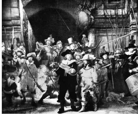
7. רמברנדט, משמר הלילה, 1642, שמן על בד, אוסף הרייקסמוזיאום, אמסטרדם