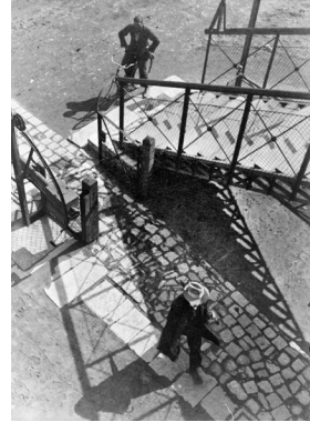
3. אימרה קינסקי, ללא כותרת, 1932, תצלום שחור-לבן, הדפסת כסף גלטינית, 29.7×21.7 ס"מ