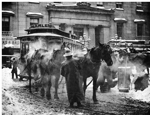
1. אלפרד שטיגליץ, טרמינל, 1893, תצלום שחור-לבן בהדפסת פוטוגרבור, 16x12.1 ס"מ